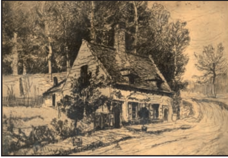
Boven : Het molenaarshuisje (naar een schets van Alfred BASTIEN)