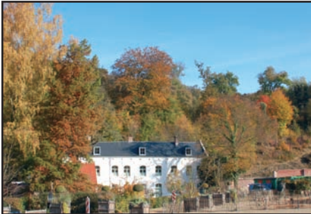
Beneden : De portierswoning